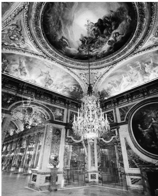
Lucien Hervé, Château de Versailles , 1962.

Hervé qui découpe dans les tirages de ses photos et qui met en évidence triangles, carrés ou trapèzes de lumière. La diagonale lui est aussi chère que l'angle droit. Le ciseau d'Henri Matisse est devenu son pinceau.